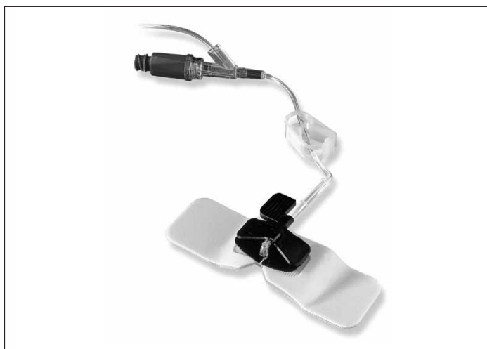
Statlock® Huber Plus® VHFP1