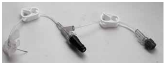
Site d'injection MICROCLAVE®